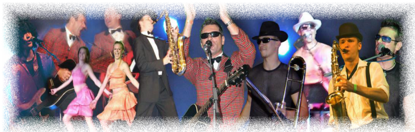
• Timbre Music