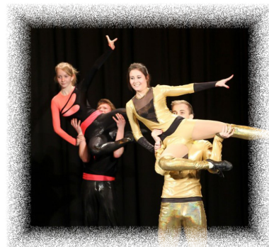
• Předtančení ve stylu akrobatického rock and rollu