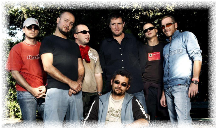
• Děda Mládek Illegal Band